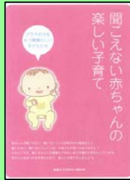
聞こえない赤ちゃんの楽しい子育て (全国ろう児をもつ親の会)