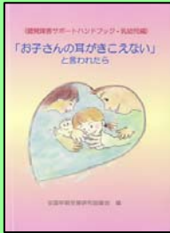
「お子さんの耳がきこえない」と言われたら (全国早期支援研究協議会)