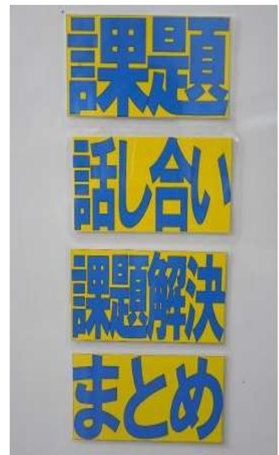
【学習過程確認シート】

生徒は、特別支援学級において事前学習を行うことで、課題に対応できるようになってきました。