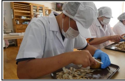
職場実習：調理作業