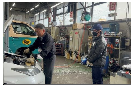
現場実習・インターンシップ