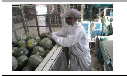
2学年現場実習：職場体験