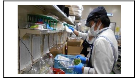
進路先別実習：企業での実習