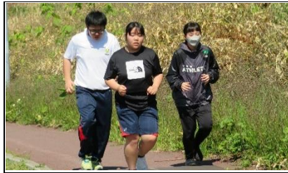
体力づくり:2.5km 校外ランニング