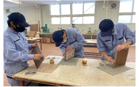
作業学習：木工作業