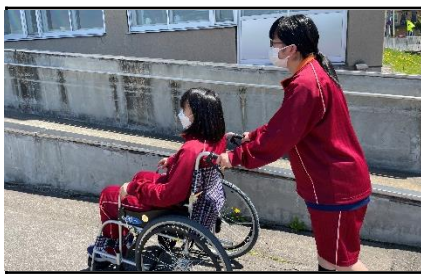
福祉サービス科：車いす介助