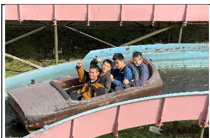
見学旅行（ルスツ方面）