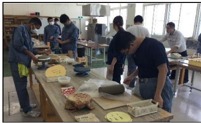
窯業科:陶芸製品の製作