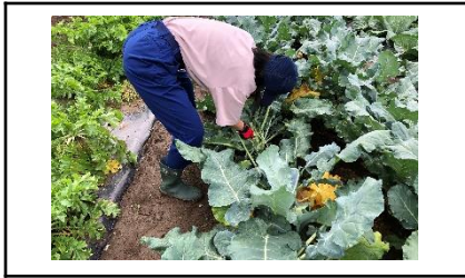
自学科実習：野菜の収穫