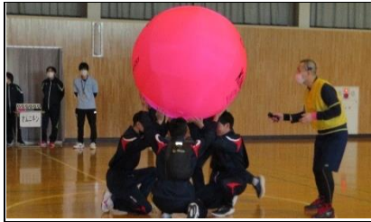
保健体育:地域講師によるキンボール指導