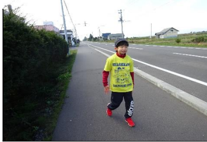
強歩マラソン大会