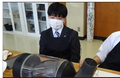
生産技術科：コーヒー焙煎