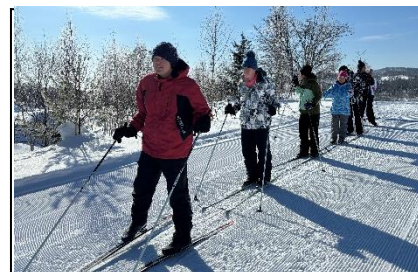
体力づくり（歩くスキー）