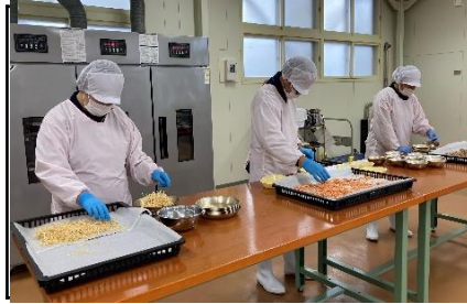
作業学習：食品乾燥作業