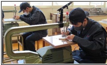
木工科:木工製品の製作