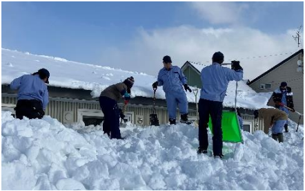
作業学習：除雪作業