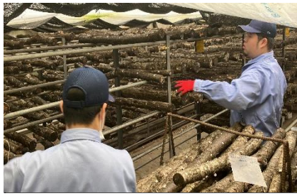
企業での作業学習