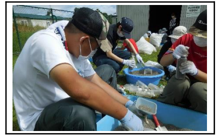
委託作業：ペットボトル砂詰め