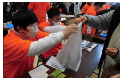
製品販売Ⅲ（永山イオン店）