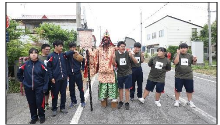
総合学習:鬼鹿殿島神社祭への参加