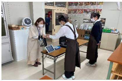
作業学習：食堂サービスでの接客 (テイクアウト)