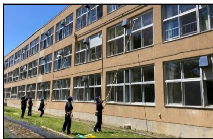
環境・流通サポート科：高窓清掃