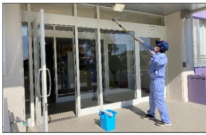
作業学習：清掃作業