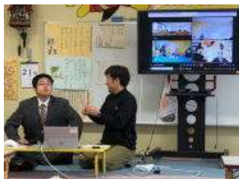
保護者教室の様子①