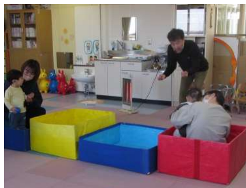
グループ活動の様子