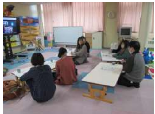
保護者教室の様子②

乳幼児相談室遠隔相談事業を通して、同じ聴覚障がい児を育てる保護者同士が不安や悩みを共有し合う中で、子供の成長に喜びを感じ、子育てに自信を持つなど、前向きな気持ちを高める機会を、学校と居住地との距離を超えて設けることができたことが何よりも大きな成果であると感じています。これも乳幼児相談室における保護者支援の役割であり、今後もこの事業を続けていきたいと思えます。