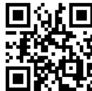
当法人のHPになります。