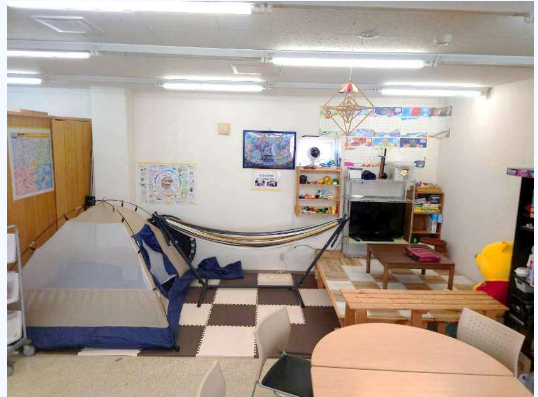
テントやハンモック、小上がりをもうけて リラックスしながら過ごせる場所