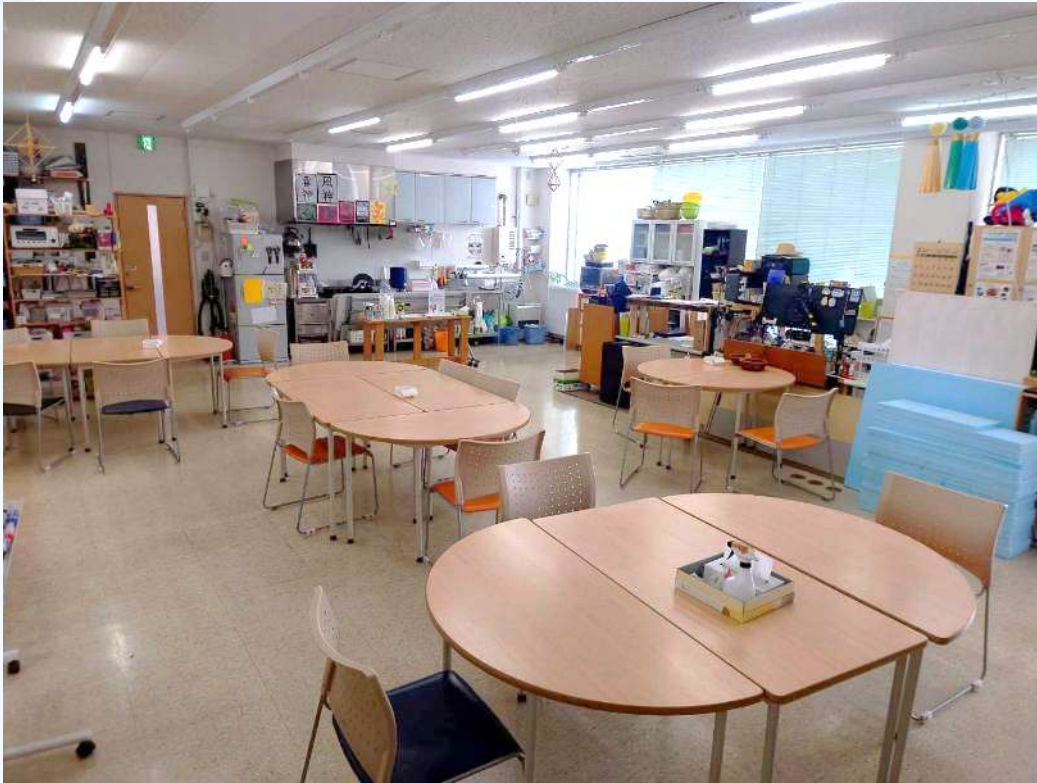
好きな場所に座って活動ができる