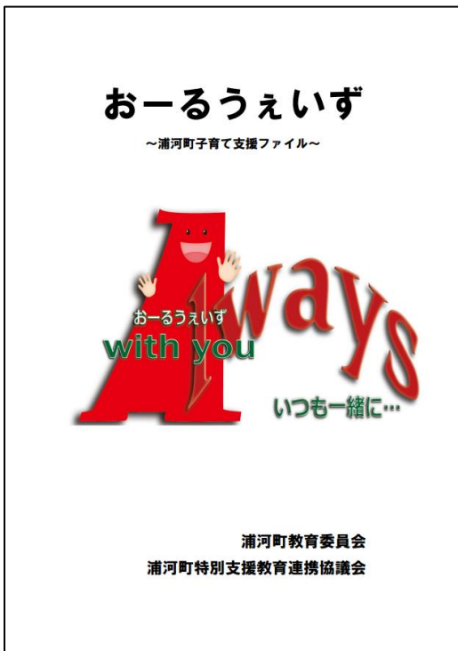
図2 [子育て支援ファイル おーるうえいず]

本町では、新小学一年生になる全ての家庭に「子育て支援ファイル おーるうえいず」(図2)を配付しています。このファイルは、子どもの成長やこれまでの様子を記録し、必要な支援につなげるためのものであり、保護者や子ども、保健・医療・福祉・教育などの関係機関が情報を共有すること(図3)で、子どもに必要な支援を整理したり、受けやすくしたりしています。子どもが就学する時期は大きな節目です。これからも当町では、各関係機関と連携しながら、保護者や子どもが安心して新しい生活を始めることができるよう支えていきます。