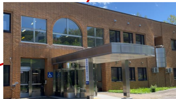
特別支援教育センター外観

子どもたちがこれからの社会を力強く生きていくためには、未来を見据えた学びを通して資質・能力を育成することが大切です。そのために、子どもたちの“ なりたい姿 ”や“ 身に付けたい力 ”を「 ともに思い描き 」ながら、未来を切り拓く持続可能な取組を推進します。