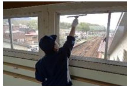
環境・流通サポート科：窓清掃