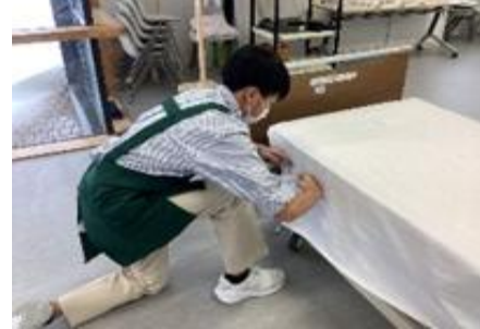
福祉サービス科：介護