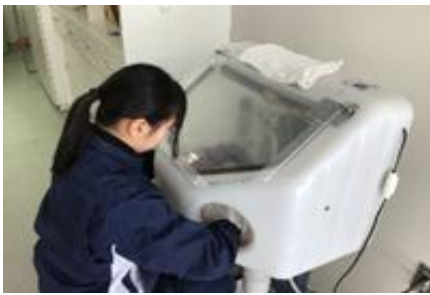
生産技術科：サンドブラスト