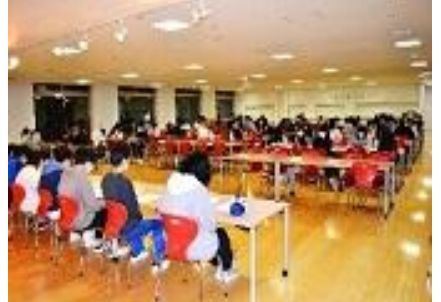
寄宿舎：舎友会総会