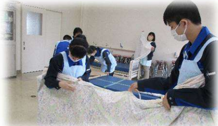
福祉サービス科 包布交換