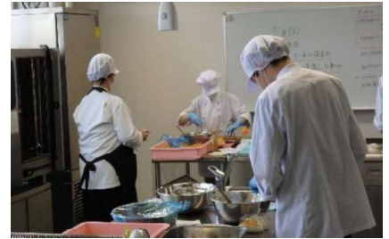
食品デザイン科: 調理、製パン