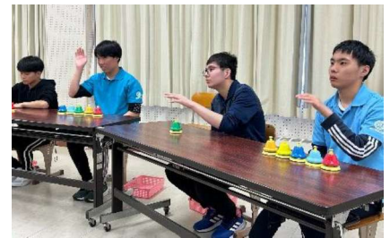
余暇音楽：器楽演奏