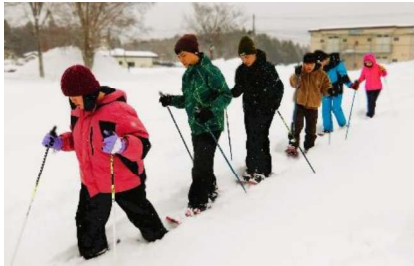
余暇体育：スノーシュー