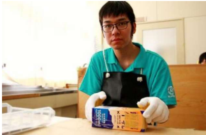
余暇制作：キャンドルづくり