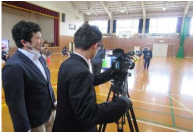
普通科:総合的な探究の時間