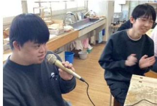
生活単元学習：カルチャークラブ