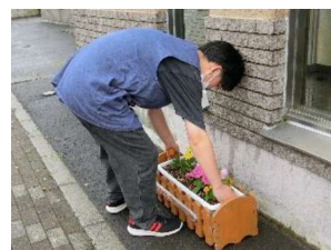
作業学習：受注作業