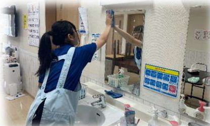
福祉サービス科 グループホームでの実習