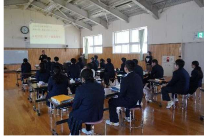
生活単元学習（進路の学習）