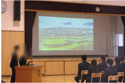
模擬株総会（探究発表）