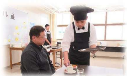
福祉サービス科 カフェ運営