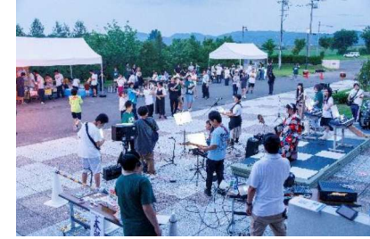
寄宿舎（サマーフェスティバル）