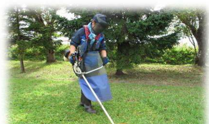
環境・流通サポート科 環境整備（草刈り）