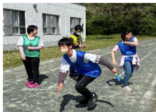
保健体育：陸上競技