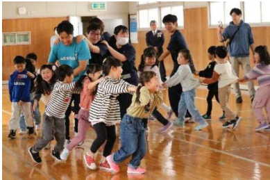
福祉デザイン科: 保育(交流)