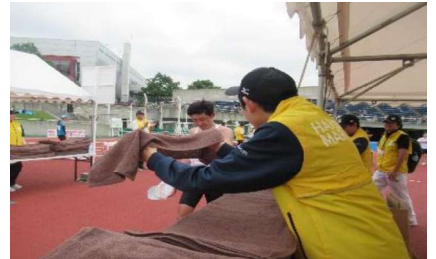
函館マラソン大会ボランティア