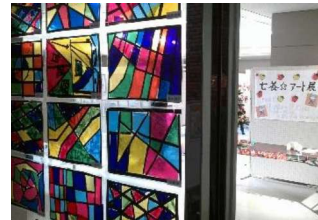
美術：七養アート展