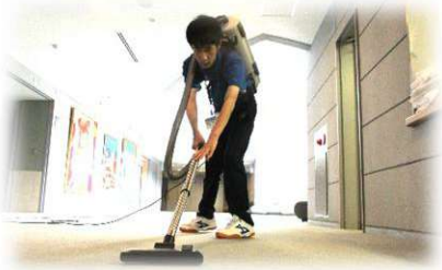
環境・流通サポート科 北斗市文化センターでの実習