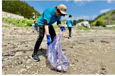
作業学習：海浜清掃