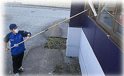
環境・流通サポート科 清川口駅での実習