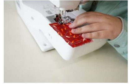
家庭総合科（縫工作業）