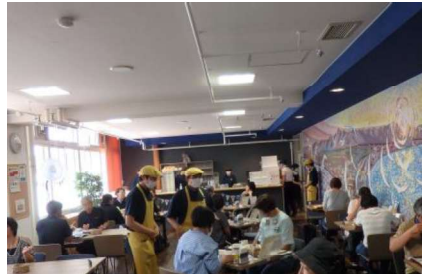
Hako cafe clover