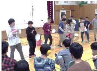
音楽：沖縄民謡鑑賞