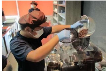
生産技術科: コーヒー豆加工