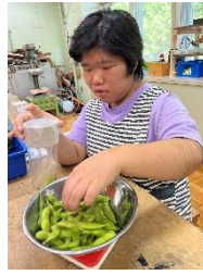
職業：枝豆の袋詰め