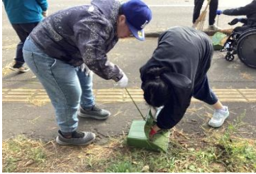
総合：呼人町の地域清掃