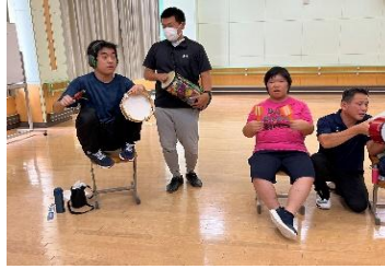
音楽：器楽で鳴らそう