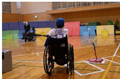
特別活動：高等部祭（野球ブース）