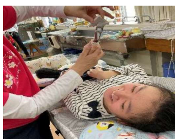
○△□でデザインしよう（美術）