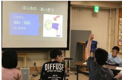
総合的な探究の時間：卒業生講話