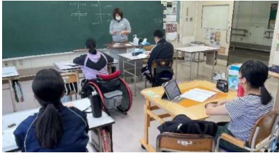
普通科：数学（習熟度別授業）