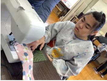
作業学習：製品作り（ミシン）