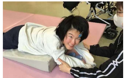
自立活動：腹臥位のストレッチ