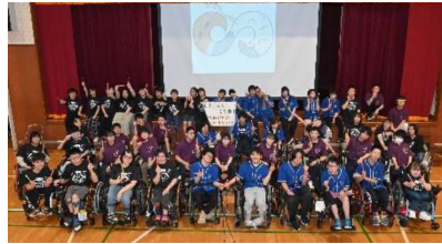
学校祭：全学年生徒記念撮影