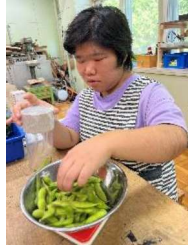
職業：枝豆の袋詰め