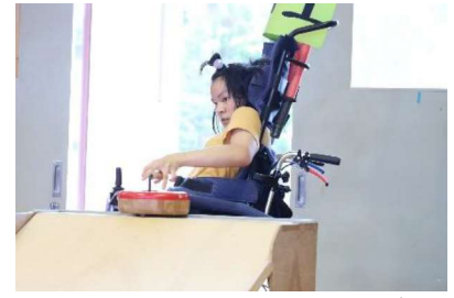
体育大会：フロアカーリング