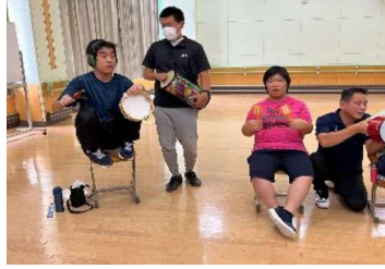
音楽：器楽で鳴らそう