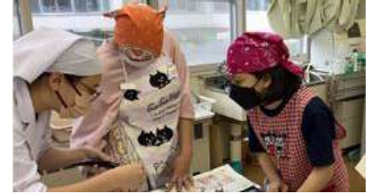
生活科学科：調理実習