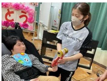
磁石のはたらき（理科）