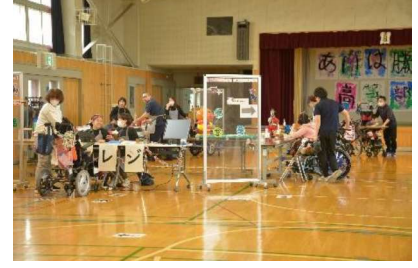
高等部祭：喫茶（接客）