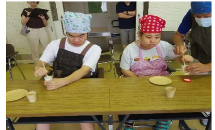
出前授業：メグミルク