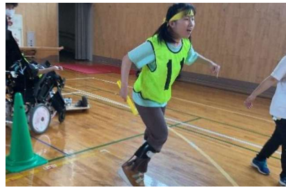
保健体育：陸上記録会