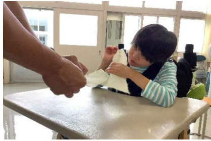
生活単元学習：和紙を使った作品