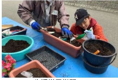
生活単元学習： フラワースマイル作戦