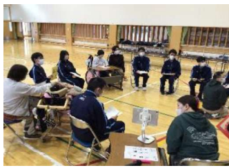
札幌稲穂高等支援学校との交流