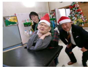
クリスマスコンサート