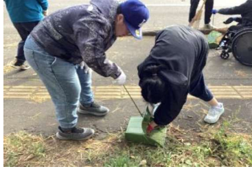
総合：呼人町の地域清掃