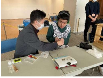
職業：販売活動の様子