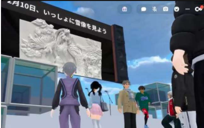
メタバース空間を活用した遠隔授業（さっぽろ雪まつり）