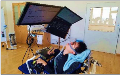
ICT機器等を活用した授業