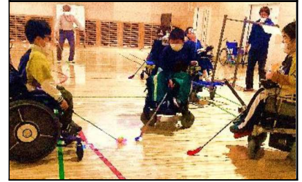
車いすを使っての体育授業（ホッケー）