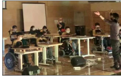
iPad音楽アプリ（Garage-Band）を活用した音楽発表