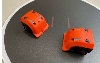
ロボットプログラミング選手権（R5全国準優勝 R6全国ベスト8）