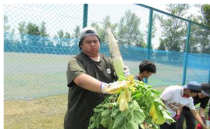
作業学習：環境整備班