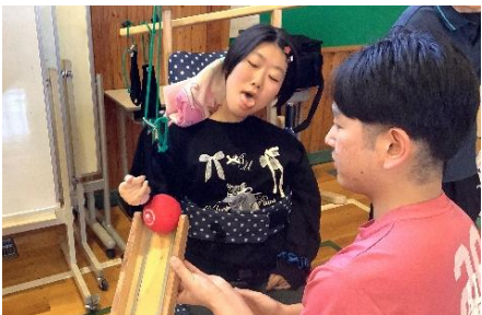
たいいくタイム：ポッチャ