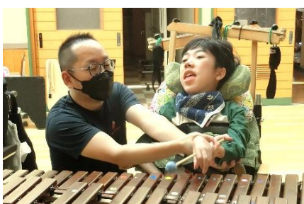
おんがくタイム：器楽（木琴）