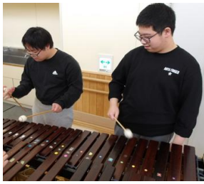
音楽：音をみつけよう！