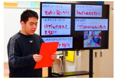
総合的な探究の時間：現場実習報告会