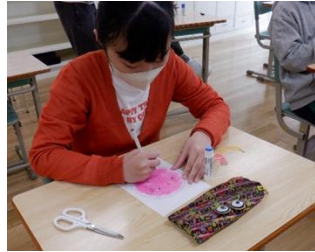
美術：野菜を描こう