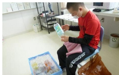
体力づくり/自立活動