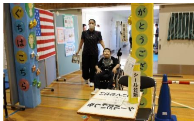
ひまわりフェスタ