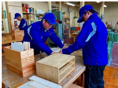
木工科：引き出しの組み立て作業