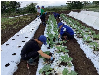
農業科：きゃべつの苗植え