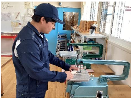
生産技術科：木工製品づくり