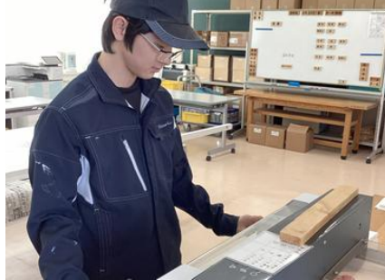
環境・流通科：製本作業