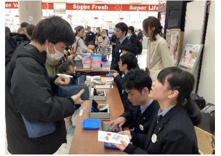
即売会：地域での販売会