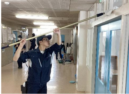
環境・流通科：清掃作業