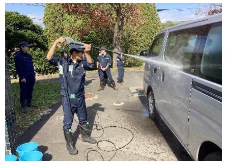
特設実習：カークリーニング