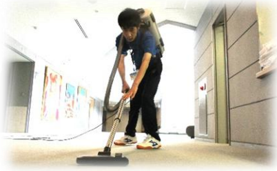
環境・流通サポート科 北斗市文化センターでの実習