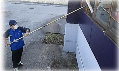
環境・流通サポート科 清川口駅での実習