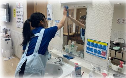
福祉サービス科 グループホームでの実習