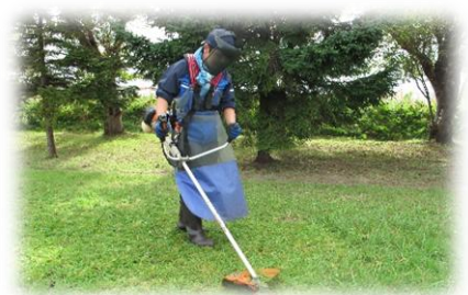
環境・流通サポート科 環境整備（草刈り）