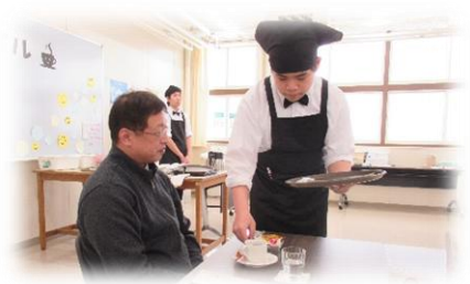
福祉サービス科 カフェ運営