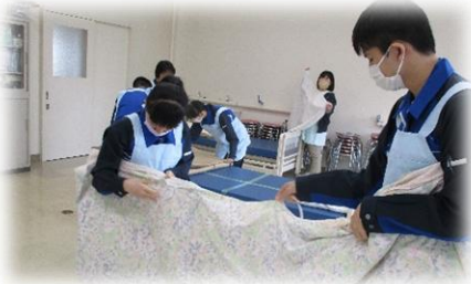
福祉サービス科 包布交換