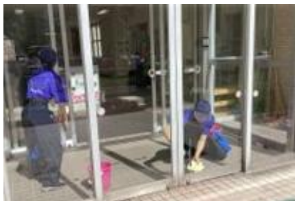
環境・流通サポート科：地域清掃