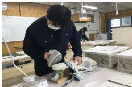
被服デザイン科：布製品の製作