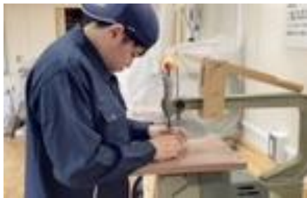
生産技術科：木工作業