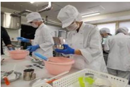
食品デザイン科：製パン作業