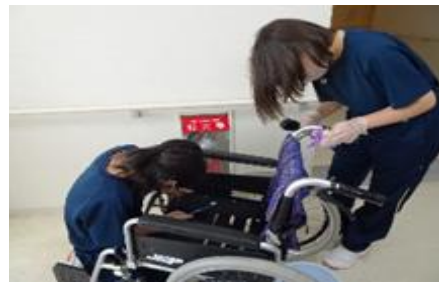
福祉サービス科：高齢者福祉